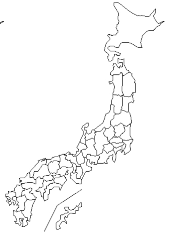
報告なし 無菌性髄膜炎