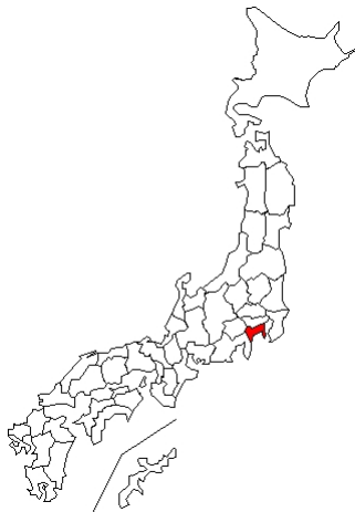
273 例 2019-nCoV