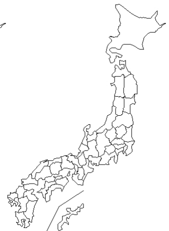
報告なし Human metapneumovirus