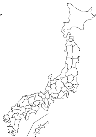
報告なし Parechovirus 3