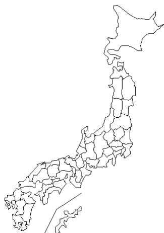
報告なし Coxsackievirus A9